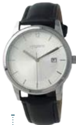
UN790A € 85,50

Collezione "Elio Black" di UNGARO. Orologio 3 lancette e datario UNGARO. Cassa in metallo 39 mm. Indici applicati, cinturino in pelle. Impermeabile 3 ATM. Elegante confezione regalo Ungaro.