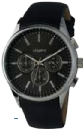
UN674A € 181,00

Collezione "Gio Chrono" di UNGARO. Orologio Cronografo, cassa in metallo 42 mm. Quadrante nero. Cinturino in elegante pelle liscia e struttura interna per dare una naturale curvatura al cinturino. Resistenza 3 ATM. Elegante confezione regalo Ungaro.