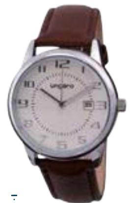
UN1715 € 79,00

Orologio 3 lancette e datario UNGARO. Cassa in metallo 40 mm. Quadrante bianco. Indici applicati, cinturino in pelle marrone. Impermeabile 3 ATM. Elegante confezione regalo Ungaro.