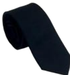
UN747N • Blu

Cravatta in seta. Confezionata in elegante scatola regalo Ungaro. Dim. 150x7 cm.