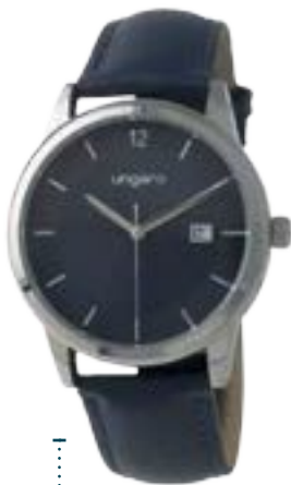
UN790N € 85,50

Collezione "Elio Blue" di UNGARO. Orologio 3 lancette e datario UNGARO. Cassa in metallo 39 mm. Indici applicati, cinturino in pelle. Impermeabile 3 ATM. Elegante confezione regalo Ungaro.