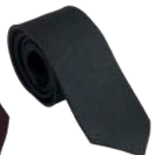
UN747J • Grigio scuro