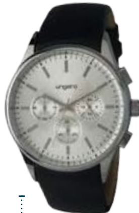
UN674C € 181,00

Collezione "Gio Chrono" di UNGARO. Orologio Cronografo, cassa in metallo 42 mm. Quadrante silver. Cinturino in elegante pelle liscia e struttura interna per dare una naturale curvatura al cinturino. Resistenza 3 ATM. Elegante confezione regalo Ungaro.