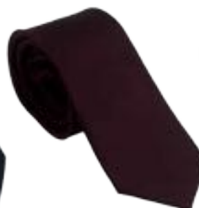
UN747R • Bordeaux