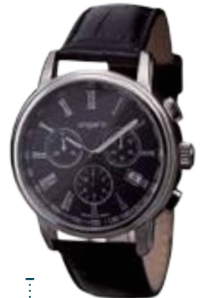
UN1325 € 266,00

Orologio Chrono di UNGARO. Cassa in acciaio 41 mm. Vetro minerale, cinturino in pelle. Meccanismo svizzero Rhonda. Resistenza 5 ATM. Elegante confezione regalo Ungaro.